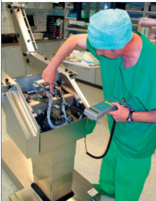
Bild 1: Ein aktuelles Beispiel ist die Beratungstätigkeit von Pamco und IAI beim Aufbau einer neuen Organisationsstruktur für den technischen Dienst (TEC) des Universitätsspitals Zürich.

Konkret gehören zum Aufgabengebiet des Facility Managements (FM) unter anderem Verwaltung und Vermietung der Immobilien und Mobilien (Kaufmännisches FM), das Betreiben und die Instandhaltung, (technisches FM), die Reinigung, Sicherheitsdienste und das Catering usw. (Hospitality/Infrastrukturelles FM). In den letzten Jahren wird immer öfters Facility Management als Dienstleistung durch externe Dienstleister geprüft und zum Teil beschafft, was als Out-