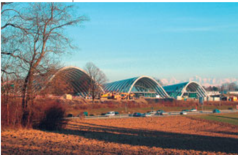
Bild 4: Das Paul Klee Zentrum in Bern, welches im Sommer 2005 eröffnet wird.

Befähigt den Auszubildenden mit so vielen Kenntnissen, dass er Instandhaltungsarbeiten selbstständig ausführen kann. Das IAI bietet die Ausbildung zum Instandhaltungsfachmann/frau für drei spezifische Branchen an: