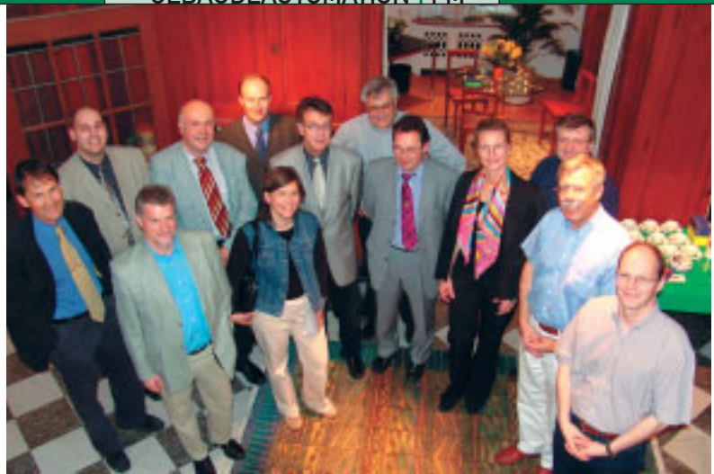
Bild 2: Die Dozenten des IAI schöpfen aus ihrer praktischen Erfahrung.